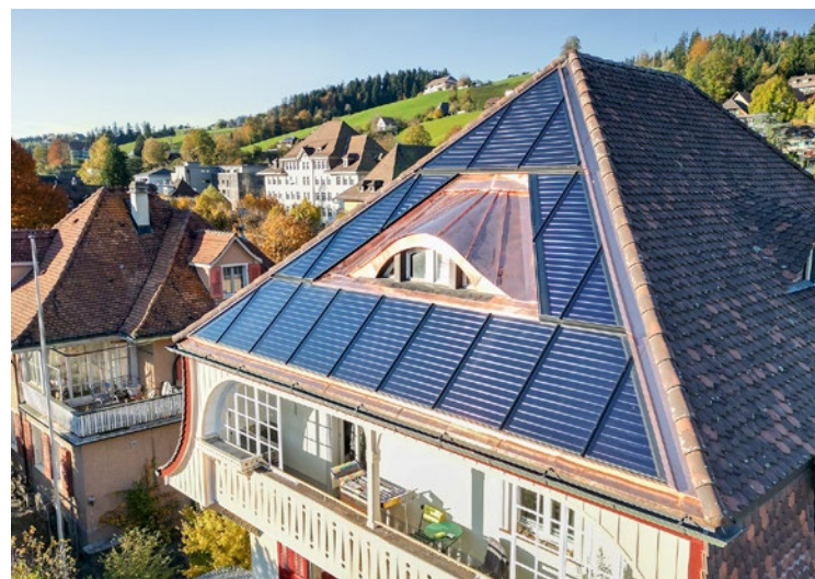
Solarthermie im Herzen des Emmentals. Die flexiblen Winkler-Elemente passen sich geschmeidig an die Dachform an, so dass die Dachfläche optimal ausgenutzt wird.