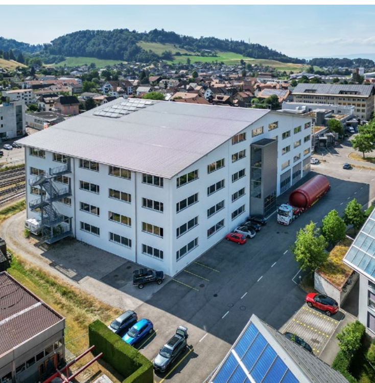
Unser Standort Oberburg bei Burgdorf. Wir blicken zuversichtlich in die Zukunft.

Der Baustart für das dritte Haus ist vorgesehen.