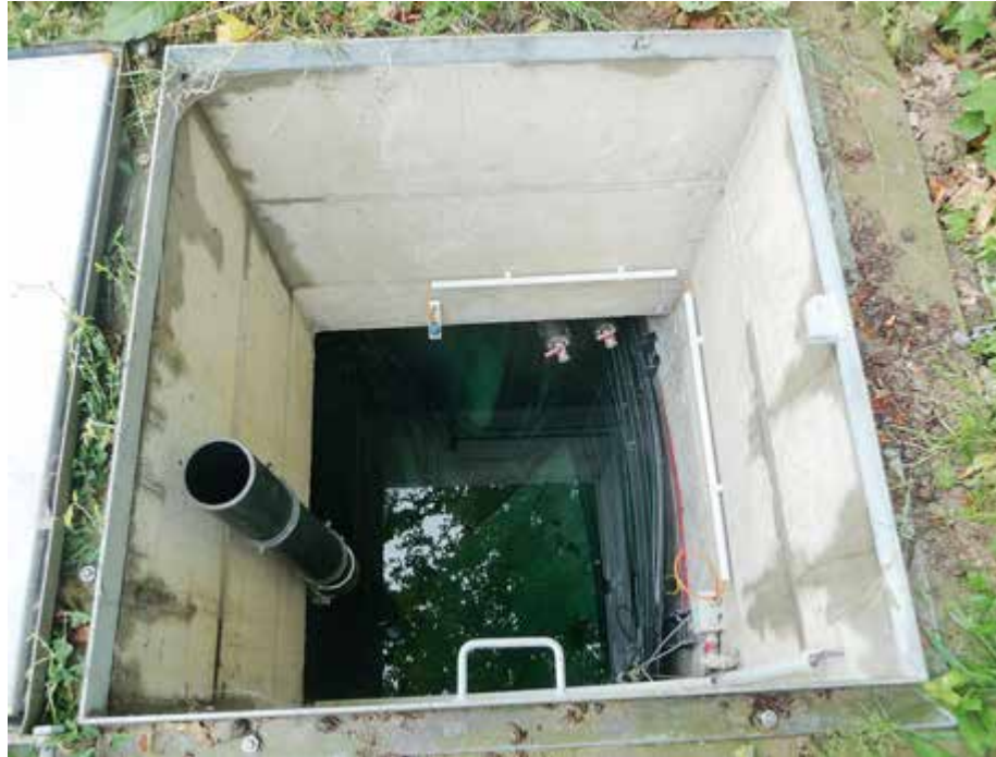
Blick in den Eisspeicher der PBS Energiesysteme GmbH in Haan: Jetzt im Sommer ist das Eis geschmolzen.

Im südbadischen Haltingen entsteht zurzeit ein neues Quartier. Geplant ist die Vernetzung von Strom, Wärme und E-Mobilität mit Car-Sharing und Mieterstrom. Ein BHKW mit 50 kW elektrischer Leistung und eine PV-Anlage produzieren Strom für die 120 Wohneinheiten im Neubaugebiet. Für die Wärmeversorgung entsteht