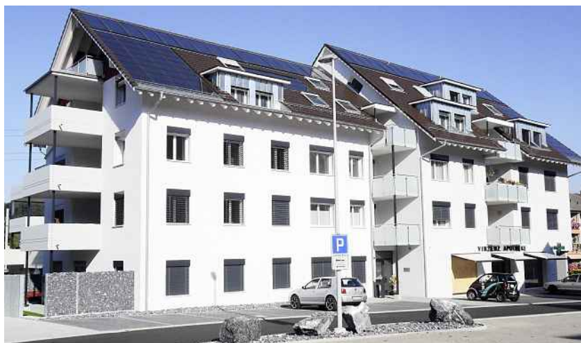
Die Überbauung «Zentrum Eiken».

Das Gebäudeleitsystem kann nicht nur die komplexe Anlage steuern: Es kommuniziert auch extern. Bei Störungen, die das System nicht selber beheben kann, wird ein SMS oder E-Mail an den Hauswart verschickt. Dieser kann mit seinem Laptop oder Smartphone auf die Anlage zugreifen und allfällige Störungen quittieren oder, weil ihm das Leitsystem anzeigt, wo die Störung liegt, den entsprechenden Kundenservice avisieren. Das Gebäudeleitsystem erlaubt auch einiges mehr: Weil dadurch die Anlage transparent wird, kann die Installation auch optimiert werden. So haben die Ingenieure in den letzten zwei Jahren etliche Einstellungen so anpassen können, dass die Anlage immer effizienter funktioniert und immer