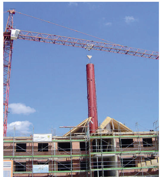
Der 18 Meter hohe Speicher wird eingebaut.

Das Gebäude produziert nicht nur Wärme, sondern auch elektrischen Strom. Eine Photovoltaik-Anlage mit einer Peak-Leistung von 8.3 kWp erzeugt Strom, der in erster Linie im Gebäude verbraucht wird. Eine allfällige Überschussproduktion wird ins Elektrizitätsnetz eingespeist. Die Stromverbraucher im Gebäude erfüllen den Standard Minergie-P. Bei den Elektrogeräten wurden nur Geräte mit der Auszeichnung «A» oder «A ++ » verwendet.