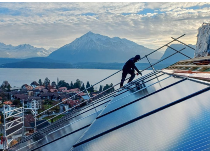
Installation Photovoltaik Oberhofen

Die eigene Vermarktung der Wohnungen im ersten Haus ist aktiv. Für das zweite Haus können wir die Verkaufspreise aktuell noch nicht festlegen.