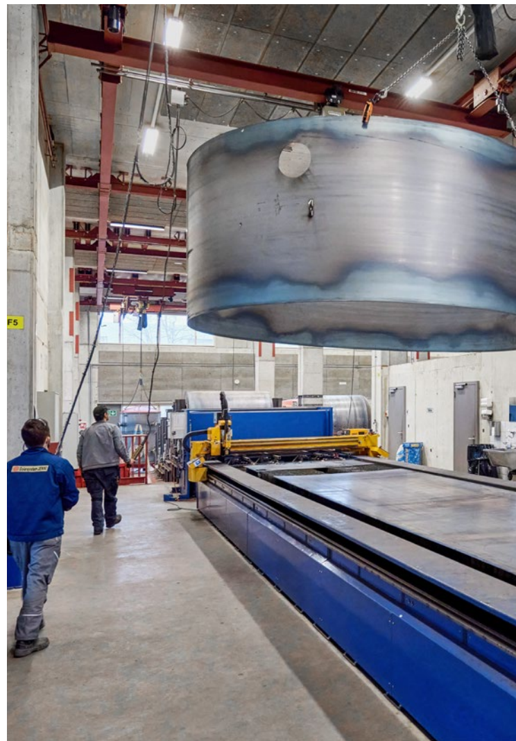
Impression Herstellung der immer grösser werdenden Energiespeicher: Durchmesser 4,8 m

Jenni Liegenschaften AG bezahlt für dieses Jahresergebnis gut 124 000 Franken Steuern an Bund und Kanton.