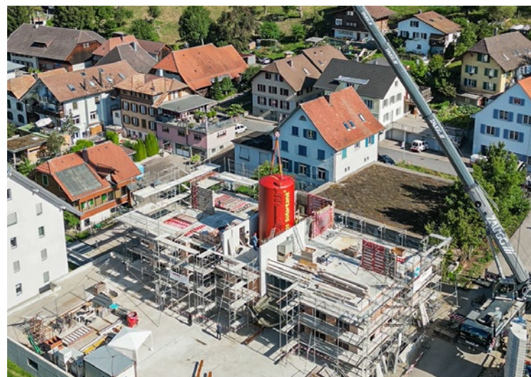
Platzieren des Energiespeichers für Haus 2 in Huttwil, August 2022