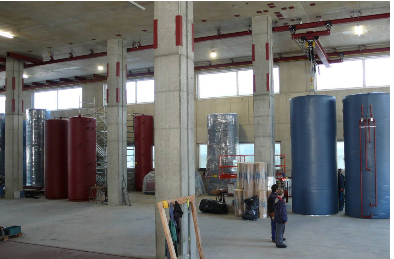
Das neue Produktionsgebäude wird vor Fertigstellung bereits als Lagerfläche genutzt