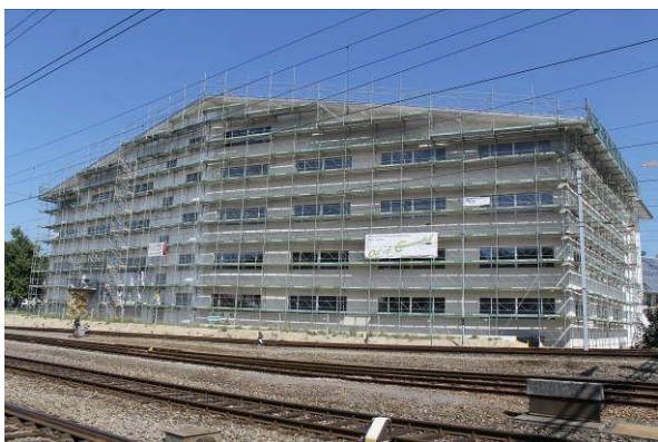
Neues Produktionsgebäude für grosse Solarspeicher in Oberburg/Burgdorf