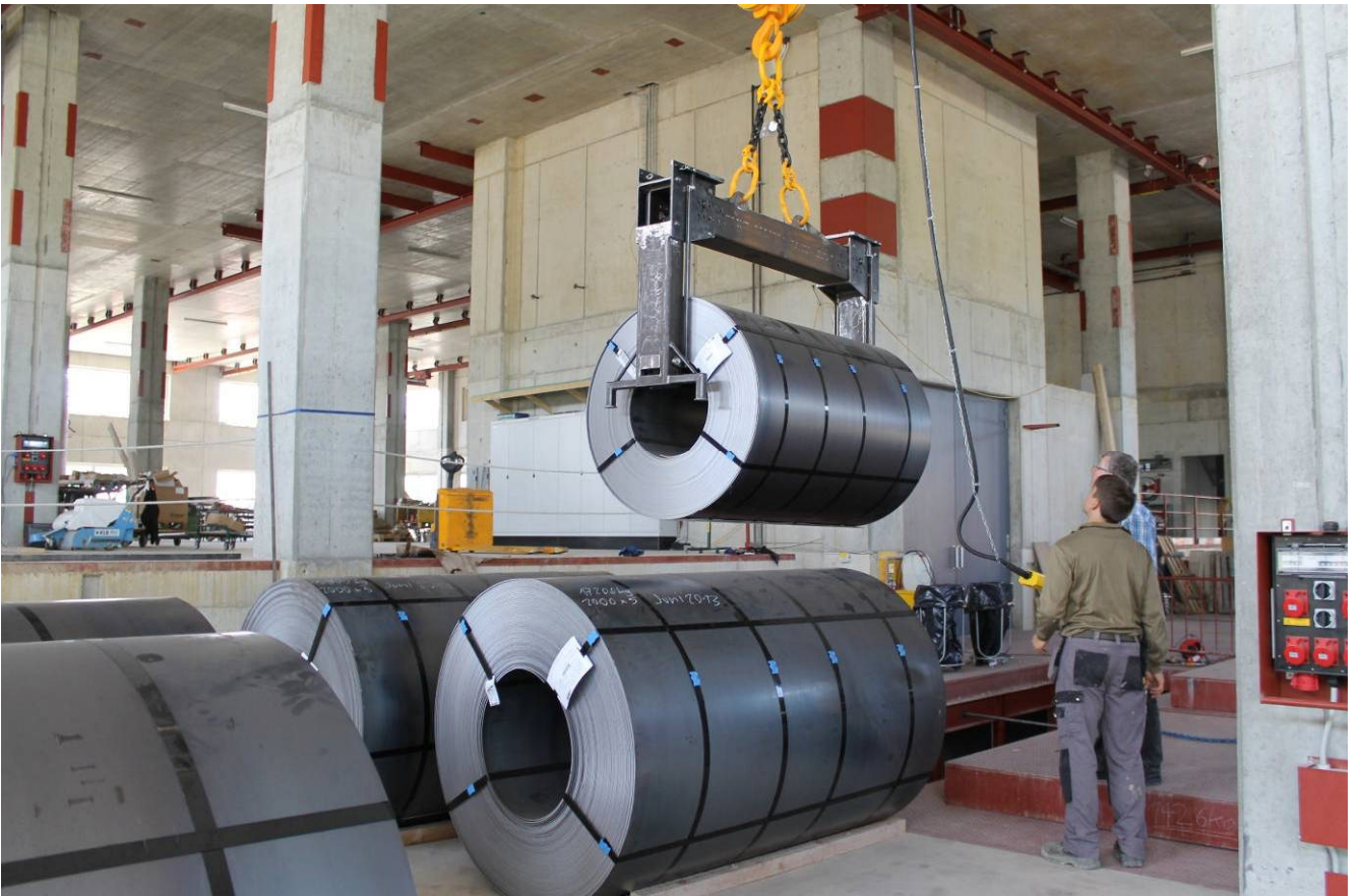
Anlieferung der ersten Stahlcoils (16 Tonnen Gewicht) im neuen Produktionsgebäude