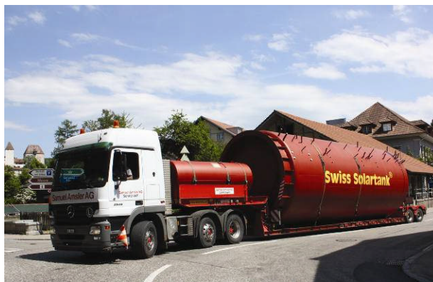
Auslieferung eines Solarspeichers nach Chemnitz (Deutschland).