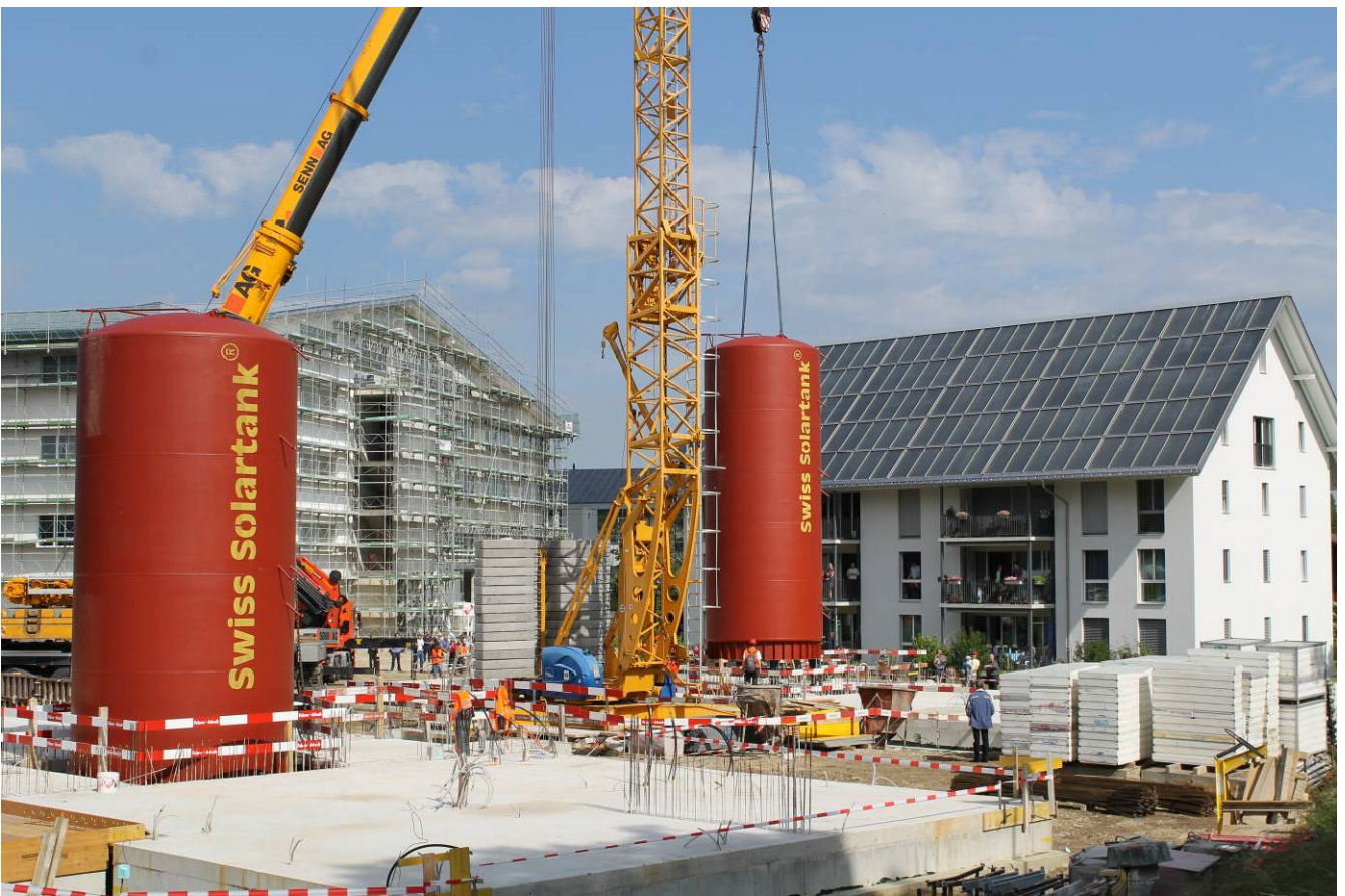
Die Speicher bei den beiden neuen Solar-Mehrfamilienhäusern werden gesetzt (15.06.13)