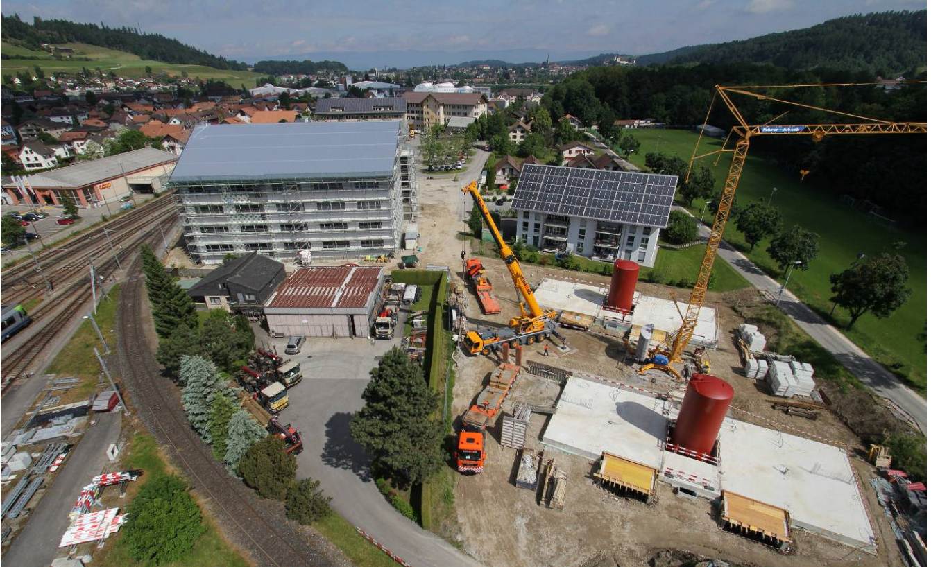
Solarpark Burgdorf (15.06.13)